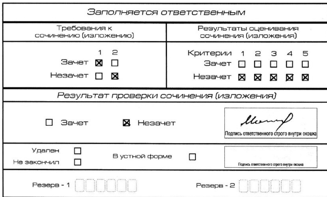
Рис. 9. Область для оценки работы

Итоговое сочинение (изложение) выполняется самостоятельно.